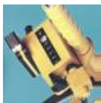
drogomierz 5000-2 z podświetleniem